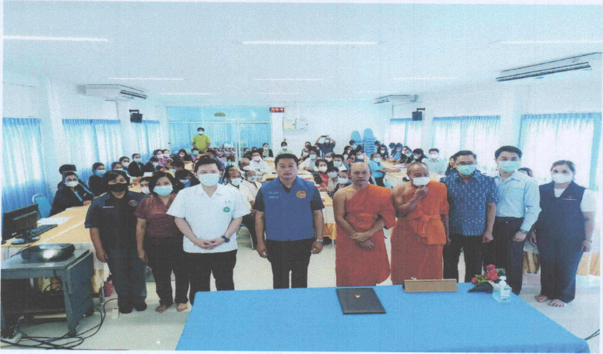
คณะกรรมการ พชอ.และภาคีเครือข่ายทุกภาคส่วน