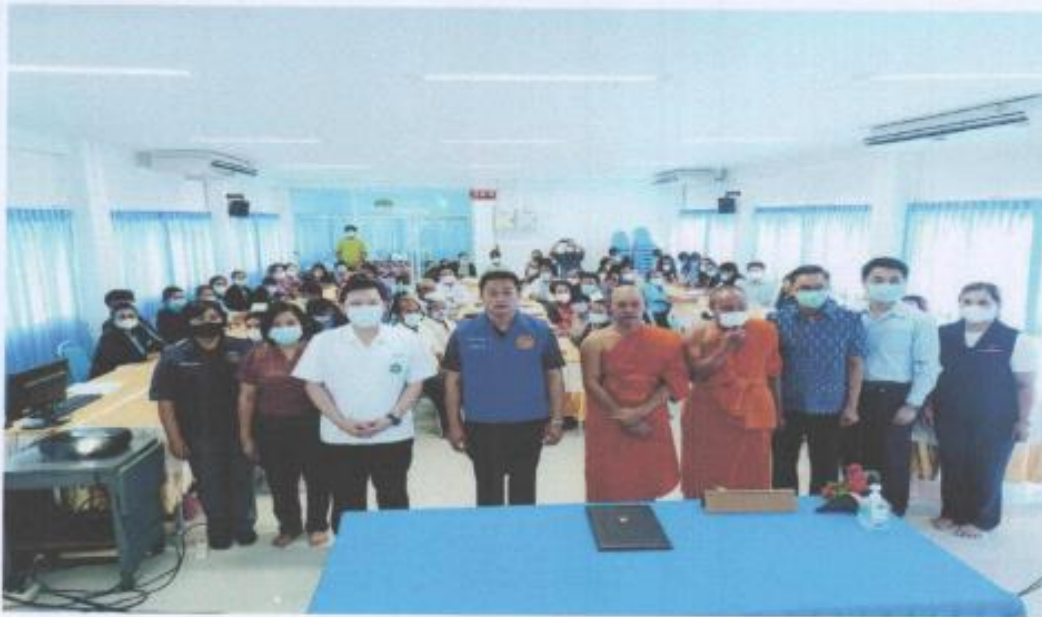
คณะกรรมการ พชอ.และภาคีเครือข่ายทุกภาคส่วน